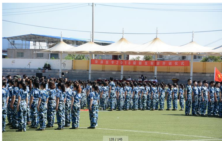
图 1 军训

每年新生入学后，开展丰富多彩的新生入学教育。除了常规的入学教育和军训活动，还通过组织开展主题班会、社会实践活动、专家讲座等形式，分专业进行大量的专业介绍和专业思想教育，请行业专家亲临学校进行职业分享，利于激起学生的学习兴趣，以及专业情感的养成，鼓励学生树立理想信念，以饱满的热情投入到专业学习中。