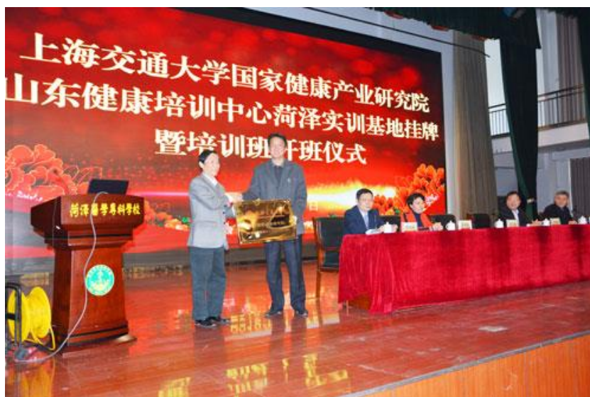
图 1 上海健康产业研究院菏泽实训基地挂牌

2018年11月7日，上海交通大学国家健康产业研究院山东健康培训中心菏泽实训基地挂牌仪式在我校学术报告厅举行。本基地将主要在应用性技能培训、学历提升、健康产业高级研修，参与国家级医养健康产业课题研究等方面开展工作，培养具有现代健康管理和健康工程技能的实用型人才。