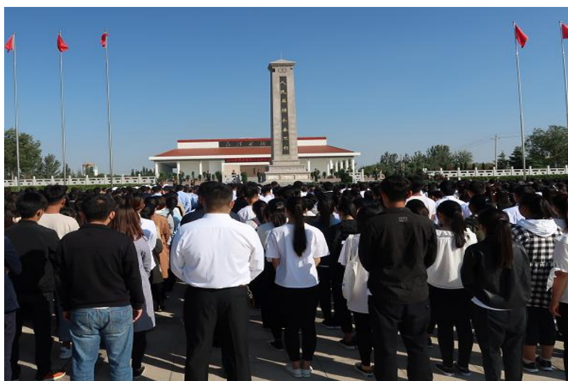
图3 师生参加菏泽市革命烈士公祭活动

注重以文化人、以文育人，用中国优秀文化滋养学生心灵以社会主义核心价值观为引领，将中华优秀传统文化和革命文化、社会主义先进文化融入教育教学，用蕴含其中的核心价值理念、传统美德、人文精神涵养师生的道德品质、文化素养。提炼、升华我校历史文化成果，充分发挥校史、校训、校风、校歌等育人功能，融合医学职业文化、菏泽地域文化，打造“绿色、阳光、仁爱、和谐”具有鲜明特色的校园文化。利用重大历史事件纪念日、爱国主义教育基地及各类革命历史遗址、烈士陵园、纪念馆等组织开展主题教育活动，组织开展中华经典诵读、礼敬中华优秀传统文化、高雅艺术进校园等活动，大力弘扬以爱国主义为核心的民族精神和以改革创新为核心的时代精神。