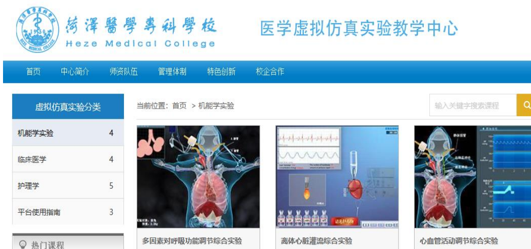
图 8 虚拟实训平台