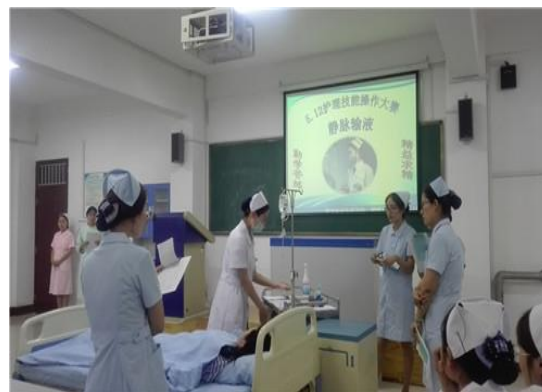
图 12 护理技能比赛