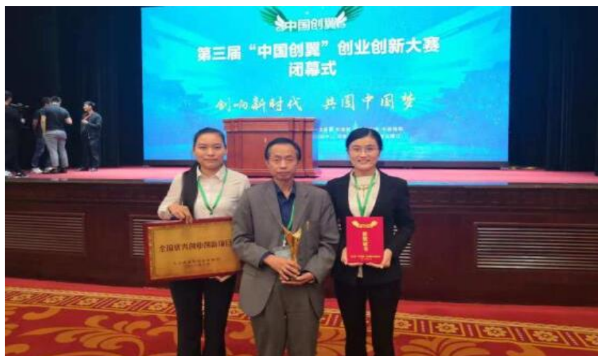
图 13 眼科科研团队