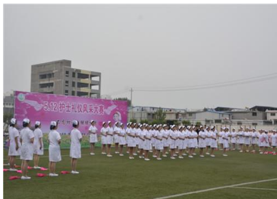
图 11 护理礼仪比赛