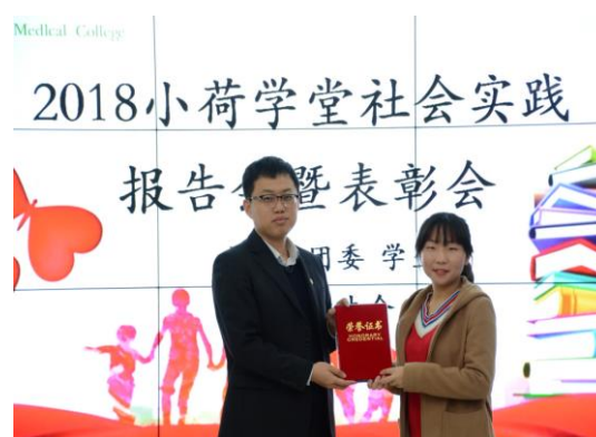
图 3 小荷学堂颁奖