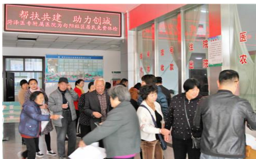
图 14 附属医院免费为句阳社区居民查体

我校自 2012 年开始建设菏泽医专附属医院，目前已经初具规模。学校投入大量资金用于购置先进诊疗设备，改善就医环境。引进高级专业技术人才 100 余名，迅速提高了医院诊疗水平，其中眼科已确立了在菏泽市的领先地位，其他科室也都取得了快速发展，医院的服务水平得到了当地居民的广泛认可。在原附属医院基础上，启动了新的附属医院建设工程。有效解决了菏泽市优质医疗资源供给不足且分布不均衡的问题。