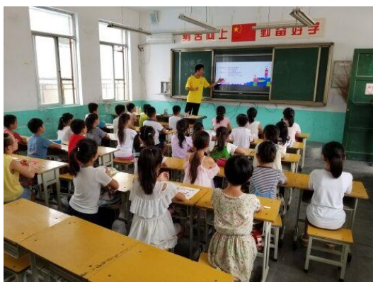
图 2 小荷学堂活动现场

此次志愿活动贯彻了习近平总书记关于青年成长成才的一系列重要论述，引导和帮助医学生在社会实践中受教育、长才干、做贡献，同时也使同学们感受到了志愿服务活动的魅力，体会到了作为志愿者身上肩负的责任。