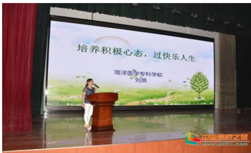
图 6 心理健康讲座

学校将心理健康课程纳入人才培养方案，在医护等专业开设《医学心理学》等作为必修课，开设《人际沟通》、《大学生心理健康教育》作为全校性的公选课，让学生系统学习心理、卫生、健康等方面的知识，有助于学生了解心理发展规律，掌握心理调节方法。学校引进知名心理学专家刘英副教授来校工作，建有大学生心理咨询室，有专业心理咨询工作人员 5 人，为学生免费提供心理咨询服务；对心理危机高危人群一方面及时与辅导员沟通情况，另一方面通过跟踪访谈或请来咨询方式密切关注。同时，学校加强对辅导员的心理咨询知识培训，部分辅导员已取得心理咨询师资格，促进学生健康心理的养成。