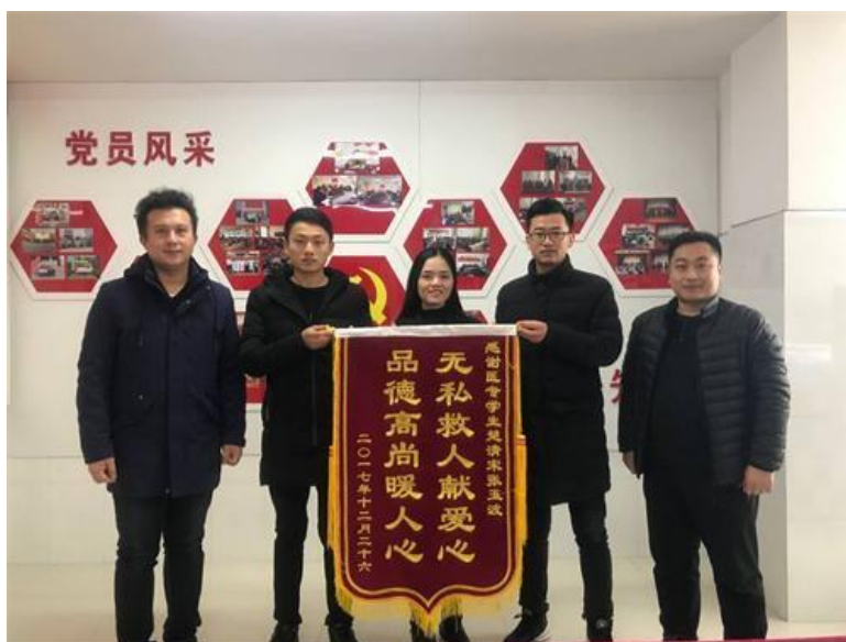
图5 无私救人献爱心，品德高尚暖人心

2018年1月5日上午，患者家属来到学校送来一面印有“无私救人献爱心，品德高尚暖人心”字样的锦旗，称两位同学为救命恩人时，两位同学直言“任何人见了都会这么做的，对医学生而言更是天职”。