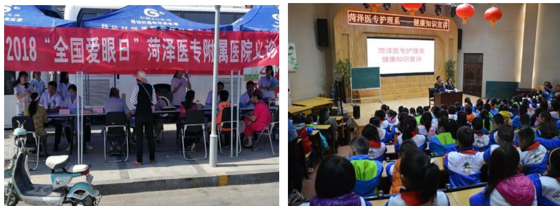
图 15 社区服务

活动，眼科免费治疗救助白内障 300 多例，为失明多年的残疾老人带来了光明。2018 年初附院被批准为菏泽市脑瘫和弱视康复定点医疗机构，9 个多月来，已经免费为 50 余名脑瘫、孤独症患者进行了针刺、言语、肢体等康复治疗，取得了良好效果。口腔科广大医务工作者积极参与到中华儿慈会开展的“微笑行动”活动中，免费为唇腭裂患者进行手术修补技术。